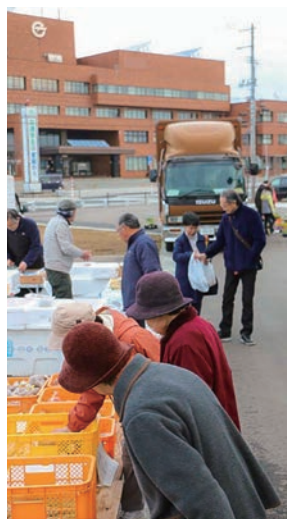
会場はビッグルーフ滝沢の駐車場。早朝からにぎわいを見せます

2015年から始まり、月曜朝6時〜8時に開催される今年で5年目を迎える「たきざわ日曜朝市」が、今年ももももオープンします。もももとは滝沢青年連絡会(滝沢市商工会青年部、農村青年クラブ、チャグチャグ馬コ同好会青年部)が中心となり立ち上げたこの朝市。毎年、毎週日曜4月〜9月朝5時〜8時、10月11日はの空気を感しながら朝市。