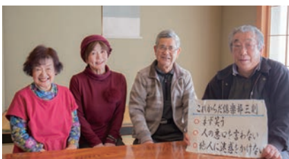
第1・3木曜にサロンを開き、イベントや会の運営について話し合われています。年会費は2,000円

「この子どもたちがシニア世代になっても来てくれるような、何十年も先へ受け継がれる朝市をめざしています。人と地域がつながる朝市になっていくことを目指していきたいですね。まずは現地にきて雰囲気を感じてほしい」と、その