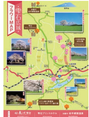
桜の名所も一目でわかる平石広域フラワーマップも付付中

鉄道」の夜をテーマとしたナイトガーデンへと姿を変え、屋上は違った幻想的な光の世界を楽しむこともできます。さまざまなイベントも豊富なので詳しくはホームページをチェックしてみてください。