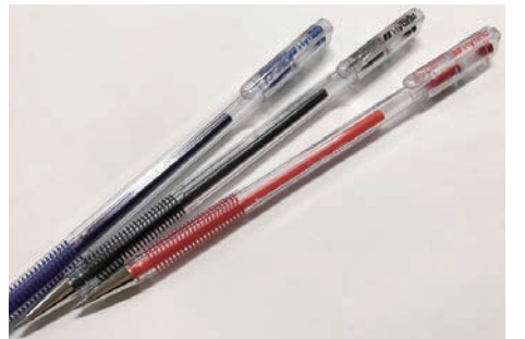
サラサラと書き心地が良く、今も愛用者が多いゲルインキボールペン「ハイブリッド」

市民ホールの花道は盛岡の客席と異なり、客席の傾斜が強いので、客席下手前面に脇花道です。花道はイベントによって各ホールその都度組み立てるのですが、当節は歌舞伎とファッションショーぐらいのものです。 「花道」とは、はなやかなものです。長谷川一夫と古川ロッパの名作映画。歌舞伎俳優、加賀屋歌右衛門と町医者土生玄碩の友情物語。命の恩人の玄碩を救うために、舞台衣装そのままに、舞台から酒席に駆けつけて踊る歌右衛門。ご存じ「男の花道」実にいいタイトルです。一度は立ちたい「男の花道」です。