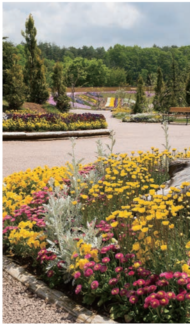
色鮮やかな草花に、心も体も癒されてはいかがですか

平成元年は1989年から始まり、皆さんとつて31年があつたという間でした。そして、この31年の間のことで強く思い出すことがあります。人生の転換期を迎えた人も多くいることでしょうか。