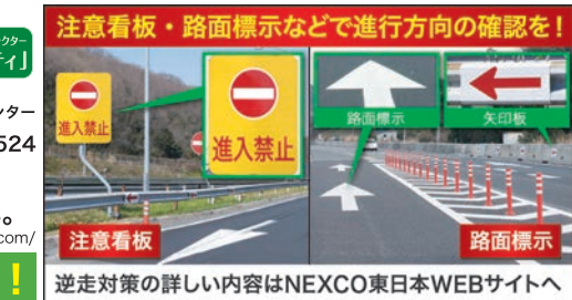
逆走対策の詳細内容はNEXCO東日本WEBサイトへ

「逆走」は、高速道路における車の逆走が多発しています。逆走は第三者などを巻き込む重大事故につながります。このような高速道路における逆走の7割弱は65歳以上の高齢の方によるものとなっています。