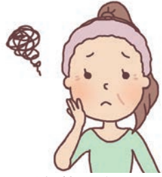
目元の印象が変わるだけで若々しくなります