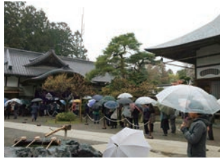
平成最後の30日、朝早くから御朱印を求める方々が長蛇の列ができました

平泉ひかるエフエムが、県内を始め、仙台などからも参加者が集まりました。この日は平安時代の芳香剤「薫物」づくりに使われた甘味料「甘葛煎」についての講演の後、参加した皆さんが甘葛煎を使った練り香りに挑戦しました。