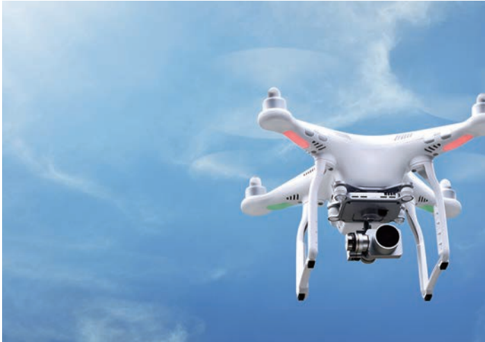
欧米諸国に遅れをとりながらもいよいよ普及段階に入ろうとしているドローン業界。日本の持つ高い技術力と確かな知識を持つ人材育成こそこれからの社会の鍵

スクールカリキュラムとして、ドローンの基本であるフライト技術の習得はもちろんのこと、航空法や電波法などの法律や安全知識の講義、フライト定義において重要な気象学までを短期間で学ぶことのできる「フライト基本技術コース」をはじめ、測量士による空中写真測量の補助を目的とした「測量基本技術コース」、構造物点検を行うための技術向上などを学べる「非破壊検査基本技術コース」な