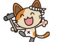
イメージキャラクター サン太郎

交通事故よりも多いヒートショックとは、急激な温度差によって血管が乱高下し、心臓や血管の疾患が起ることをヒートショックと呼びます。 ヒートショックが発端となり、死亡に至ってしまう方の数は、交通事故よりも圧倒的に多く、特に寒さの厳しい12〜1月を中心に事故が多発しています。ヒートショックが起りやすい