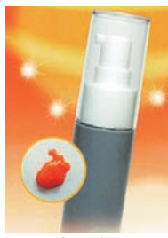
マッコも愛用する人気のジェル

これからの季節、夏場と変わらなく紫外線、紫外線が強いというところを皆さんはご存知でしょうか。冬時期は夏よりも太陽が低い位置にあるために、直に紫外線を体に浴びやすくなります。紫外線によって、体に活性酸素が増え、それが結果として病気を引き起こす原因になると言われています。日焼け止めだけでなく、肌には積極的に吸収してしまい、増加する このアスタキサンチンには、ビタミンCが6000倍、コエンザイムQ10の8000倍の強力な抗酸化力があり、その成分が配合になった「アスタキサンチン配合ジェル」が当店でも処方開始しました。活性酸素から肌を守り、メラニン産生を抑制することでシミ改善や美白効果に高い効力を発揮します。数ある美容ジェルの中でもしっとり感が違い、潤いで年齢よりも若く見せられると、好評をいただいています。 朝、起きるのが楽しくなる。そんな感覚をぜひ、お試しください。 さくら美容形成クリニック 0120(7)73992 盛岡市盛岡駅前通13-8 鳴海ビル2F