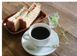
店おすすめ「ホットサンド(400円)」と「今月のコーヒー(380円)」

を営む3人でスペイン料理も提供していたそうだが、現在は軽食とコーヒーをメインに夫婦2人で営んでいます。長い時間ゆったり過ごせる