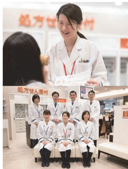
血圧・血糖測定をもとに、スタッフ全員で健康づくりをサポートします

処方箋のお薬を準備し説明をしてお渡しする薬局が多いなか、予防と養生の観点から病気になるににくい体づくりの提案やアドバイスを行なってくれる薬局があるのはご存知ですか。