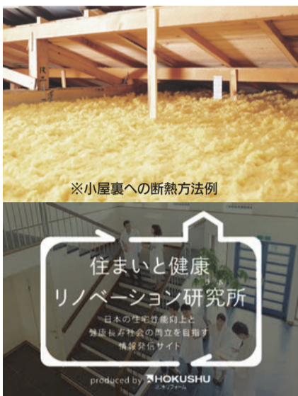
北洲リフォームでは、「住まいと健康」にまつわる情報発信サイトを開設。健康寿命の延伸に役立つ情報を発信しています

冬が終わり、春の陽気を感じる頃とすると、寒い冬にはヒートショックの危険が高まることから、住まいの温度管理と健康管理に一層気を付けなければなりません。ですから、安心して暮らすためにも住まいの断熱性を高めることが