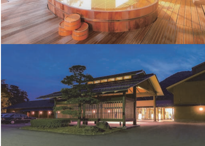
個室でプライベートな空間を楽しめる「佳松園」。施設の設備、行き届いたサービスは、日常を忘れさせ、毎日の疲れを吹き飛ばしてくれます。社員旅行プランは1室4名様ご利用の場合、1泊2食お一人様22,000円(税別)社員の福利厚生に利用するのもいいかもしれません

今年そんな「佳松園」の毎年人気の特別宿泊券の販売期間が延長され、5月末まで購入ができるようになりまし