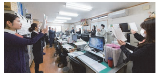
毎朝の朝礼の様子。理念や考え方の復唱を行っている

まずは、地元が本社があること(ごまかしがきかない)。次に20年以上の歴史があること(経営基盤がしっかりしている)。そして社員が50人以上いること(人員が欠けても機能する)。「家は一生もの。私たちは