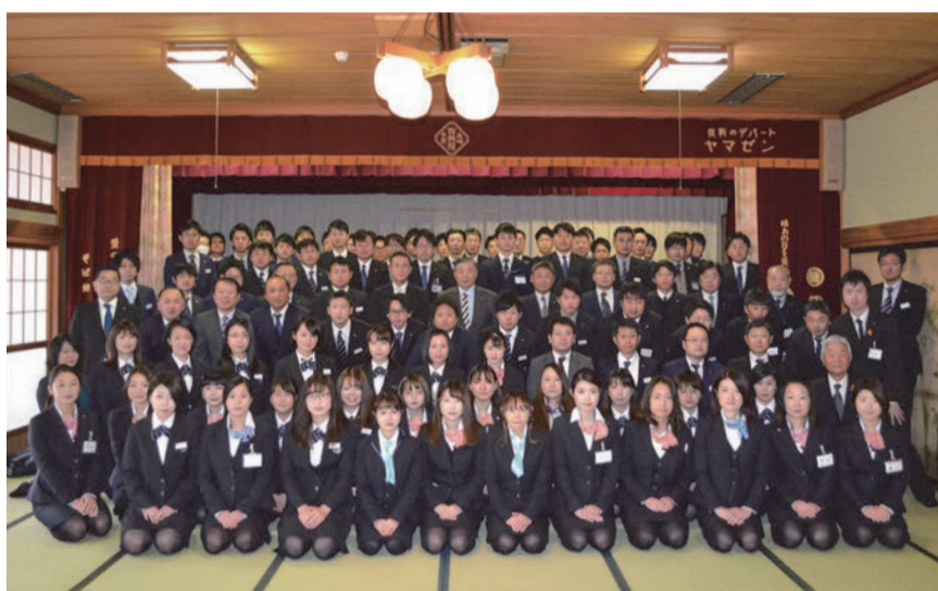
シリウスグループの集合写真

充てられるよう、入社時に最大20万円を支給している。「奨学金を借りて大学に通った子が多く、社会人になったと同時に返済が待っている。支度金で少しでも気持ち楽になったり、『これから頑張っていく』とモチベーションを上げる手助けになればという思いからだ。