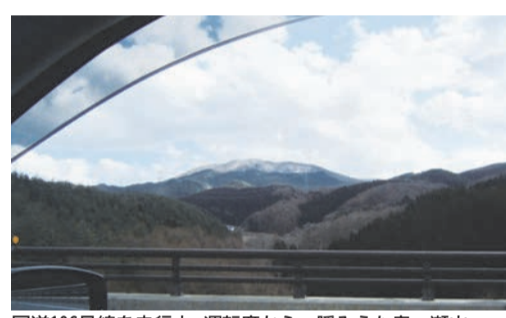
国道106号線を走行中、運転席から一瞬みえた鬼ヶ瀬山。車を止めるスペースはない

一瞬、出現するからだ。それから黒い岩塊にまつわるス波氏の家臣が鬼ヶ瀬に住み、夜な夜な城下町で悪争をはたらいたという。名は