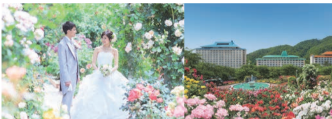
新施設のオープンが続々と迫っている花巻温泉「足湯・手湯」「無料フィットネスルーム」「パラ園」と見所が絶えません。 ※情報は発行時点のものとなります。新型コロナウイルス感染症拡大防止に伴い変更となる場合がございます

トです。また、5月30日には県内の温泉施設では初となる「無料フィットネスルーム」がホテル紅葉館にオープンします。ランニングマシンやアップライトバイク、ベンチプレスなど充実の設備を宿泊の方は無料で利用できます。フィットネスルームで体を動かして汗をかき、温泉でリフレッシュ。温泉の新しい楽しみ方を提供しています。