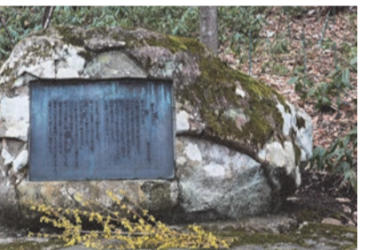
没後に建立された詩碑には、花巻での初冬に書いた「雪白く積もり」が刻まれている

晩年を花巻で過ごした芸術の天才 高村光太郎の人物 明治、昭和を芸術とともに生き抜いた日本を代表する彫刻家・詩人、高村光太郎。その光太郎が昭和20年