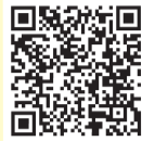
詳しくは 厚生労働省のホームページへ