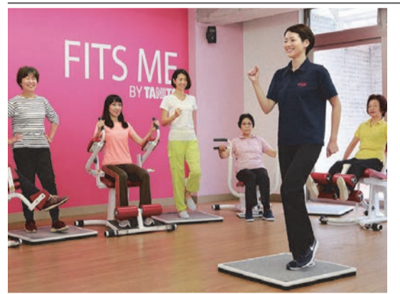
1回たったの30分。無理なく運動習慣を身につけられます

季節は春を迎えています。が、暖かい時期になってくると「体を動かして運動不足を解消したい」「健康のためにダイエットしたい」などという方も多いのでは。年齢を重ねてくると、だんだん運動するのがおっくうになったり、自己流でのトレーニングが大事です。女性専用のお手軽簡単30分フィットネス「タニタフィットミー」では、9種のマシンを使った筋力トレーニングと、軽快な音楽のせてウォーキングなどの有酸素運動を30秒ずつ交互に繰り返すサーキットトレーニングを行います。この2