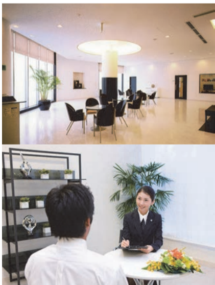
予約を入れなくてもご相談いただけます

ライフスタイルが多様化している今、お葬式のスタイルも大きく変化しています。家族葬や生前葬に関するお問い合わせが増えています。昔は2世代、3世代で緒