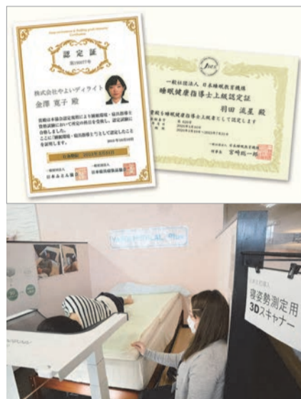
日本寝具寝装品協会に認定された資格保持者が在籍しております。お悩みに合わせた国産寝具をプロがご提案いたします

たくさんある寝具のなかから自分に合うものを探すのは大変です。やよいリビングでは、「社日本寝具寝装品協会認定の睡眠環境・寝具指導士が、あなたにぴったりの寝具をご提案いたします。