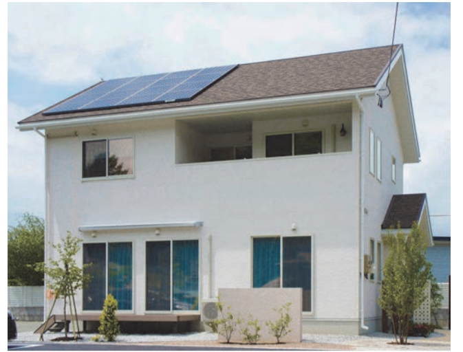
岩手県持ち家着工数15年連続No.1を達成したシリウスグループ。「星の数ほどある住宅会社の中から選んでくれたことに感謝し、絶対にお客様のためになると誓い、自分が持てる力を全て用いて最高のアドバイスをし、幸せな家族生活が送れる家づくりを全力でサポートすること」。社にも掲げたこの思いを胸に、住宅の提供を行っている