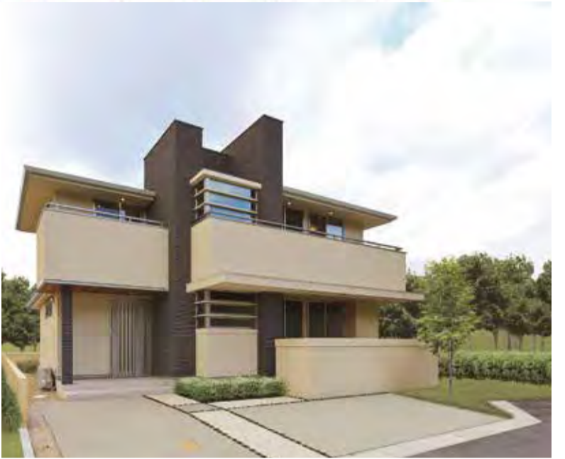
最近完成したオーガニックハウス