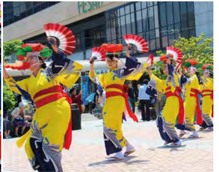
いずれも資料写真です。