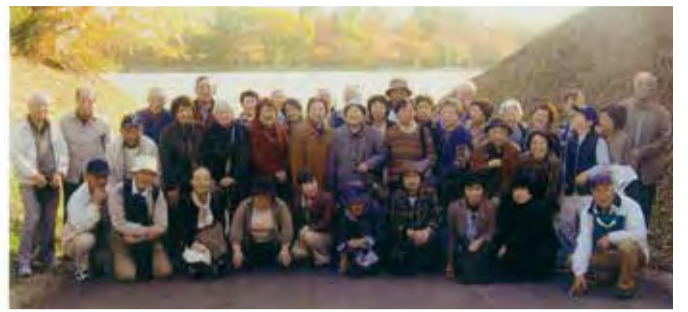
八幡平への温泉日帰り旅行

野住宅の緑寿会。特に力をいれたい。地域の絆を深めるため、奉仕活動です。毎月2、3回行う資源ゴミの分別をはじめ、秋には落葉