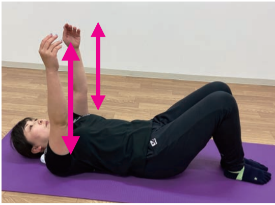
両腕を天井に向けて伸ばしたまま、矢印のように上げ下げします

①仰向けに寝て膝を三角にたてます。首の下に丸めたタオルを入れておきます。 ②両腕を天井に向け、腕を伸ばし、そのまま上げ下げします。(上げるとき、肩甲骨は床から少し離れ、すく腕が天井からつられて ③両手の次は、片手ずつ交互に行います。腕の角度を変えて行うと、さらに整います。 【実感ポイント】 背中がより広くベタリと床に感じるようになります。冷房で肩周りが冷えて、コリを感じていませんか。一日の終わりにぜひやってみてください。 ※日本コンディショニング協会 のメニューを使用しています。