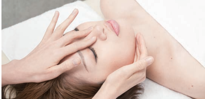
鼻の高さや鼻筋、顔の輪郭を整えることで、お顔立ち全体を美しく際立たせます

「隆鼻正士」といった隆鼻矯正専門の資格取得者がオールハンドで施術をしてくれるので安心です。鼻の根元から高さを出すことで、顔の中心である鼻の悩みとコンプレックスとして多くの方が悩まされています。隆鼻とは何だろうとお思いの方には、説明。隆鼻とは、低い鼻や形の悪い鼻を高くしたり、形を良くする美容手術のことです。