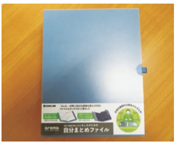
自分まとめファイル キングジムAM2525 ¥4,800+税

よる避難も多くなっ ています。避難所に「最低限 これだけは持っていく」と いった場合にも持ち運びで きるサイズですので貴重品 の流出を防げます。いざと いときのために普段から 貴重品の整理を行い、家族 の安心、自分の身を守るこ とをオススメいたします。 平金商店バスTEL館 盛岡市着町8-18 (肴町アーケード南側) ☎019(65)22881