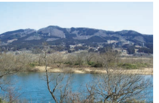
新幹線一関トンネル(全長10km)は、東稲山の真下を貫いている。光りあふれる地上と、暗闇の地中とが対をなす

／かかるべしとは、歌僧として名高い西行法師が平泉を訪れたのは、26歳と1186年69歳のときだった。大文字の送り火で有名な斜面を進むと、展望のよい駒形山に立つ。眼下に北上川と平泉の町並みひろがり、南に観音山（1057年没）の時代に植えられたと聞く。近年、往時の桜山を復活させようという取り組みが、さまざまな種類の桜、塚山は、駒形山より北東へ1.4km。愛馬連山を眺めたら、いよいよ頂上へ向かう。