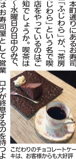
こだわりのチョコレートケーキは、お客様からも大好評