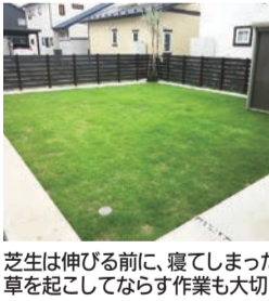
芝生は伸びる前に、寝てしまった草を刈って作業も大切