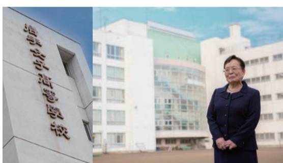
敷地の外からも見える「岩手女子高等学校」の文字。北京の姉妹校の先生に書いてもらったもの

「先生に なるとは思っていなかった」 持ってほしいということだ した。教員と栄養士の資格