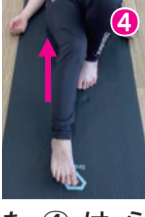
③伸ばした脚を股関節から内側に向けて倒す。④内側に向けたまま膝を