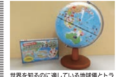
世界を知るのに通している地球儀とトランプです。国旗付地球儀は¥7,700(税込) トランプは¥1,650(税込)

また感染症対策は自動検温器、アルコール消毒液、二酸化炭素濃度計、アクリルボードを設置しておりますので安心して来店できます。