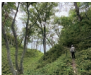
海を目前に林道を進みます

短時間で縦走が魅力の田代山 今回は拡大版ということで、「二つの山」を紹介。「もうだー田代山を登ろう」。八幡平市の北、西根寺田にある田代平高原は今、グリーンシーズン真っ盛り。健康的で体にやさしい登山をしたい、ミドリに癒されたい、四季折々の自然を味わいたいと思つとき、私はお気に入りの山スポット「田代山」を登る。 最大の魅力は、トイレのある駐車場を起点に「3時間くらいで縦走」できること。時計回りでも逆回りでもOK。県道30号を東へ200m歩き、古い作業小屋から草原へ。分岐で右の道へ進み、樹林帯をジグザグに登って尾根に上がる。 林から飛び出すと、眼下に田代平高原がパッと広がり、汗ばんだ体も爽快だ。目の前にドーンとそびえる七時雨山の北峰。南峰は隠れて見えないが、ふもとの牧野や幾何学文様のキャベツ畑が相まって、ヨーロッパ的な風景美を醸し出す。上昇気流に乗った霧が、風景を閉じたり開いたり。この浮遊感はまだ宇宙旅行だ。昔、放牧された馬がササを食むうちに立ったという「駒木立山」へ登り、さらに田代山・三方沢山・三曲山とつなぎ、サン燦道口へ下れば展望の縦走は終了する。七時雨カルデラライン(外輪山)に囲まれた高原の暗