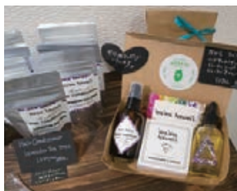
コスメはせっけん、ハンドジェル、オイルなどがありギフトにもおすすめ

仕出しで有名な美藤から「ハワイアンテイストでカジュアルなお弁当の店」MANA UP MORIOKAが盛岡市内丸にオープン。MANAはハワイの言葉で、魂や神聖な力を意味し、体内のパワー(MANA)をアップし、よつと名付けられました。