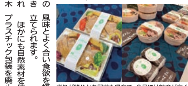
彩りが鮮やかな野菜も県産で、8月には糖度が高みずみずしい自根きゅうりのピクルスを販売予定

で作られる。だから良いものを食べて体の中からきれいになってもらいたい」という思いから、すべてのメニューで無添加のニユーで無添加の体に優しい調味料を使用しています。