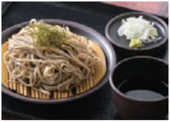
全店共通メニューのざるそば