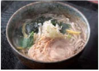
盛岡・本宮店限定の鶏チャーシュー塩そば

「GOOD LUCK」でおなじみの公衆グループに本格的な十割そばを提供する「そば処楽屋」があることを皆さんはご存知でしょうか。ウインズ7店舗(盛岡・ライオン・本宮・宮古・北上・奥州・一関・気仙沼)に併設する「そば処楽屋」では、国産のそば粉に拘った十割そばを提供しています。各店舗には、製麺機が導入されており、「挽きたて」「打ち立て」「茹でたて」のそばは、大変好評です。