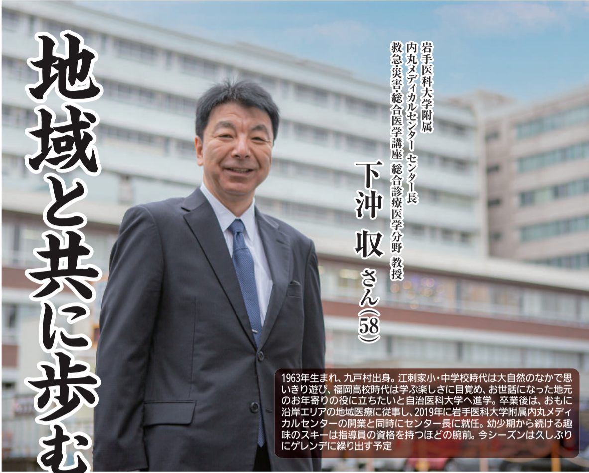
岩手医科大学附属 内丸メディカルセンターセンター長 救急災害総合医学講座 総合診療医学分野 教授