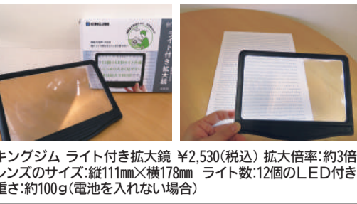
キングジム ライト付き拡大鏡 ¥2,530(税込) 拡大倍率:約3倍 レンズのサイズ:縦111mm×横178mm ライト数:12個のLED付き 重さ:約100g(電池を入れない場合)

普通の拡大鏡が一番と、自由に使え時代になっていくと良いですね。平金商店ハステル館盛岡市着町818(着町アーケード南側) 019(65)2(288)1