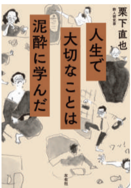
著: 栗下直也 / 左右社 1,980円(税込)

コロナ禍が落ち着きはじ、盛岡の繁華街にも賑わいが戻つつある、今日この頃。数年越しの忘年会も今年はあちらこちらで行われることでしょうか。