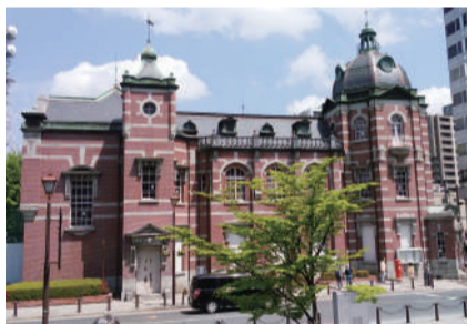
岩手銀行赤レンガ館外観

岩手学習センター ☎019-653-7414 盛岡市上田3-18-8(岩手大学構内)