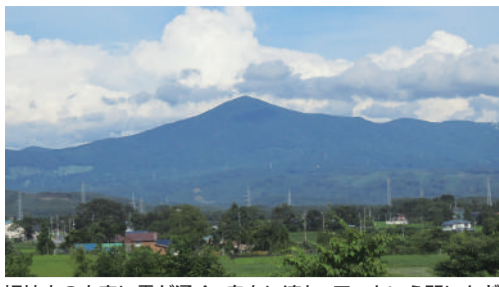
姫神山の上空に雲が湧く。自在に流れ、アツという間にちぎれて消える。天逆の歌人は「雲は天才である」と言った

通年型の山として人気の高い姫神山は、その昔、山伏たちが修行を積んだ霊験あらたかな山域であった。駐車場とトイレのある一本杉登山口のほか、こわ坂コース、田代コース、南から登る城内コースは、採石場のあ