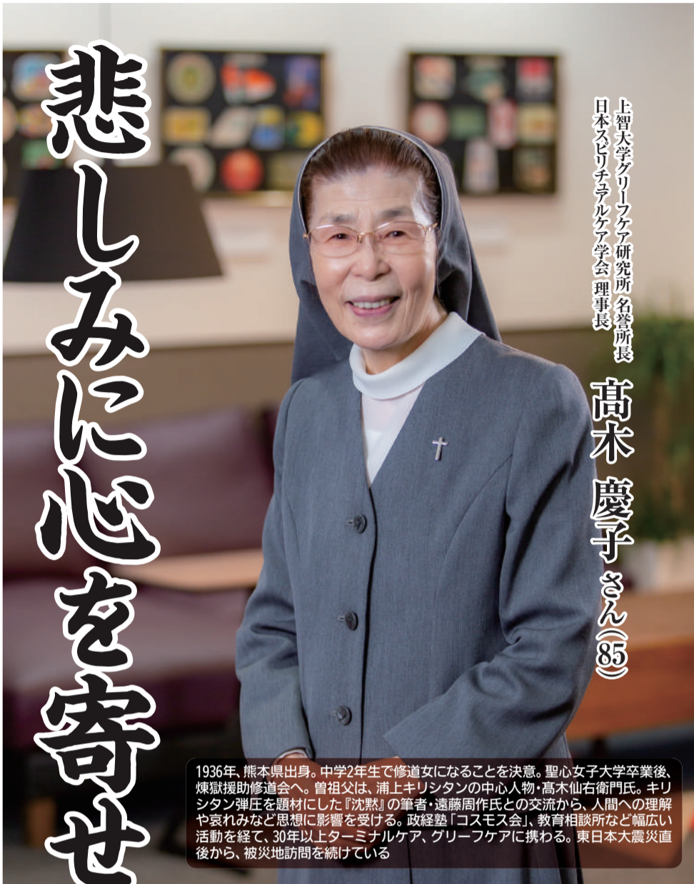
上智大学グリーンケア研究所名誉所長 日本スピリチュアルケア学会理事長