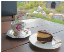
コーヒーと季節限定のケーキ。大きい窓から庭を眺めながら味わうメニューは格別

自家焙煎した豆を岩手山の湧水で淹れた香り豊かなコーヒーは水道水では出せないクリアな味わいで、素材にこだわったケーキやタルトのおいしさを一層引き立てます。岩手山の裾野を彩る景色を眺めながら至福の時間を過ごしませんか。滝沢市鶴飼花平100-1 ☎019(680)2030 ※ペットの同伴。営業時間外の敷地内の立ち入りはご遠慮ください。