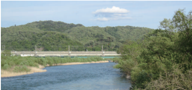
和賀川に架かる「九年橋」の歩道で国見山を眺める。雲の右下に悲観展望台、長い尾根を左に進むと珊瑚岳

IBCラジオ放送 「いわての山トレッキングガイド」 (毎週土曜日6:45~7:00)に出演中