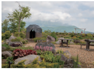
丹精込めて作られたロックガーデン。天気の良い日は岩手山が一望できる

最後にあえて私的妄想の範疇として書くが、ロシアは太平洋戦争末期の混乱に乗じて奪っていった北方四島を返す気などさらさらない。それどころかロシアが次に欲しているのは日本の北海道かもしれない。北海道が奪えれば、ロシアは現状よりもっと日本近海(日本海の北部やオホーツク海など)を自由に往来でき、