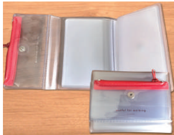
ダイゴ issmoni. カードファイル ¥1,100(税込) カードを10枚収納できます。カラーは6色展開