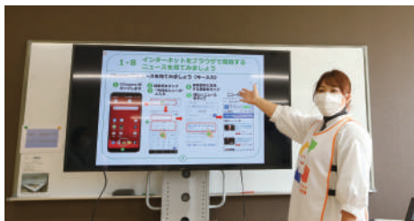
スマホ講座の様子

019-635-7711 盛岡市本宮2丁目21-20 営/9～19時 休/日曜・祝日・第一土曜日