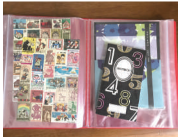
キングジム クリアファイルチャックタイプ ¥748(税込) 品番:NO.8730 赤、黒、白、水色、黄の5色展開 サイズ:A5サイズ

今年のGWの辺りから、コロナ禍での人の行動が変わってきたように感じます。県内にも旅行者や出張客が少しずつ