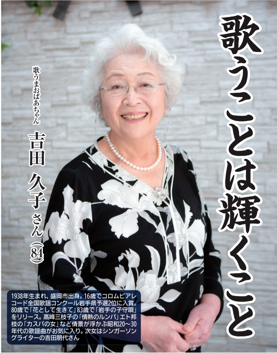
歌うまおばあちゃん