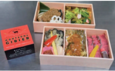
岩手・大槌鹿をおいしく楽しめる「MANA UP BOX」3,500円(税込)完全予約制で6,000円以上で配達無料

なかでも鹿肉をお弁当に使用することにした経緯と、会いに行きたそう。「ワイルドだけと繊細で丁寧な仕事を感じられる兼澤さんが獲れる特別。ジビエ料理ってフレンチのイメージですが、焼いて塩だけでもすばらしくおいしい。それをさらにおいしくして消費者の皆さまに提供するのが私たちの仕事」と共感し、課題解決のためこのお弁当の発売に至ったと言います。