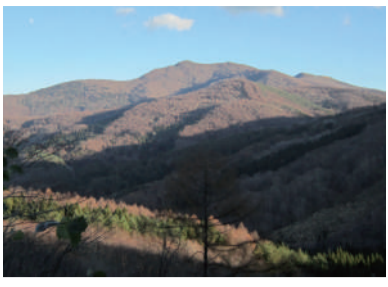
笛吹峠から残照に輝く片羽山を望む。雄岳の稜線の右奥に雌岳が寄り添う。釜石鉱山を支えた堂々の風格である

釜石に、俵屋宗達(たはやむねたか)の風神(かみかみ)が通る。がとおる絶景の頂がある。担った橋野鉄鉱山高炉跡(はしのてつこうたか)は、2015年に世界遺産「片羽山」だ。連なる二つの山にそれぞれ雄岳と雌岳(1291m)と名付けた。両羽で飛翔する鳥や、芽吹き(めぶき)の双葉(ふたば)にたとえたことで、双耳峰(ふたみみ)とは言い難いこの山のユニークな山容を表す。