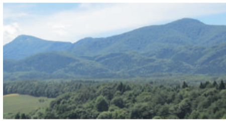
和光の三角点展望台に寄ってみた。神馬が遊び回ったという駒ヶ岳、左に経塚山が並ぶ。緑の大地に圧倒される