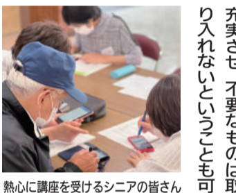
熱心に講座を受けるシニアの皆さん

皆さん、今月もスマホ講座がはじまりました。今回のテーマは「アプリ」です。スマホを使用する上で、よく聞く言葉の一つなのではないでしょうか。本来は「アプリケーション」といい、特定の目的を持って作られた機能のことです。 まず、スマホとガラケーの大きな違いとして、必要な機能を取捨選択できることが挙げられます。ご自身にとって必要な機能をより充実させ、不要なものは取り入れないということも可能