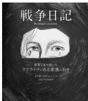
著:オリガ・グレンニク 河出書房新社刊/1,595円(税込)