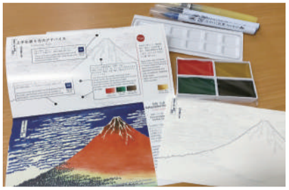
商品名:おうちで名画コレクション 塗り絵で北斎A 価格:¥1650(税込) メーカー:呉竹 品番:HAC-3

芸術の秋を迎えました。誰かの作品がきっかけで、軽に楽しみたい、絵を描いてみたい方が増えています。思ったことはありませんが、道具をいから揃えて始めるというのは、結構手間がかかります。 一つ目は、カラー筆ペンです。数年前からじわじわと人気上昇中で、今注目の画材です。カラーパリエーションが豊富で、筆先がメーカーによって異なります。自分好みのペンを探すのもいいですね。また、重ね塗りや混色が可能な商品も多く、水筆で上からなぞると水彩画のように色の濃さを調整できるなど、表現の幅が広がります。穂先を使うので、塗り方の