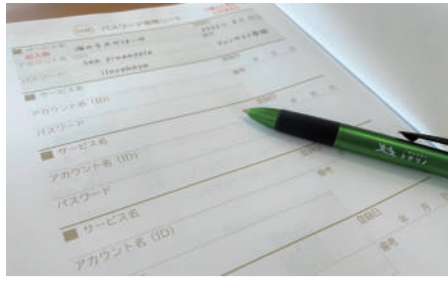
ID、パスワードの管理はしっかりと

「色鮮やかなカラー画材」の魅力を紹介します。数年前からじわじわと人気上昇中で、今注目の画材です。カラーパリエーションが豊富で、筆先がメーカーによって異なります。自分好みのペンを探すのもいいですね。また、重ね塗りや混色が可能な商品も多く、水筆で上からなぞると水彩画のように色の濃さを調整できるなど、表現の幅が広がります。穂先を使うので、塗り方の