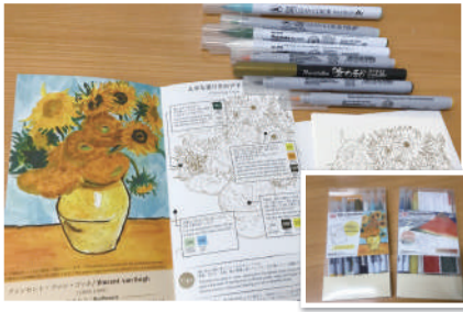
商品名:おうちで名画コレクション 塗り絵でゴッホA 価格:¥1595(税込) メーカー:呉竹 品番:HAC-1