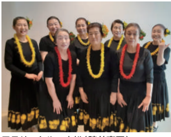
フラサークル一本松(陸前高田) この日は地元、奇跡の一本松ホールで初舞台!