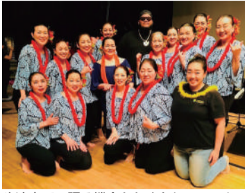
生演奏での踊る機会もたくさん。ハワイの若手人気ミュージシャン、ジョシュ・タトフィさんと1枚(盛岡校)