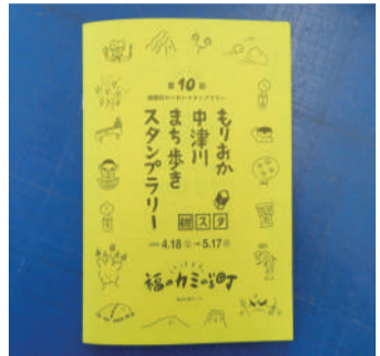
前回のスタンプラリーのスタンプ帳。今回もオリジナルのスタンプ帳を発売予定です。