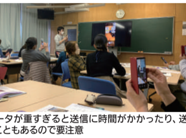
写真データが重すぎると送信に時間がかかったり、送れないこともあるので要注意

みなさん、こんにちは。コロナの制限も緩和されてきて、少しずつ家族や仲間と会えるようになり、写真を撮る機会も増えてきたと思います。撮影した写真を家族やお友だちに共有したい時、どのような方法をとりますか。現像している写真であれば、そのまま現物を渡すことができますが、データとなるとそうはいきません。今回は、たくさんある方法の中で、2つの方法をお伝えいたします。