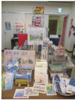
平金商店パステル館の盛岡の魅力が詰まったグッズの売り場

コロナ禍で数年の間控えていた観光も、地域によつては観光客が徐々に戻りつつあるようです。今年は盛岡にいろいろな地域からおいでになる方が増えることと、せつかく第2位のお墨付きをいただいたので、専用のスタンプブックです。盛岡を訪問し、お