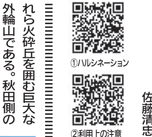
①ハルシネーション ②利用上の注意