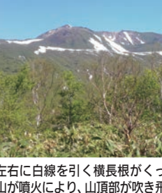
左右に白線を引く横長根がくっきり。富士山型の山が噴火により、山頂部が吹き飛んだと推定される

秋田駒ヶ岳は火山である。代であった。秋田駒ヶ岳は、1万年以前、9月17日未明に地震があり、18日夜に女岳が噴火した。「岩塊をつかんで返したらカッカと赤かった」とは地球学者が語った驚きのエピソードだが、打ち上げ花火のように噴出する火山弾を一目見ようと、横長溶岩塊の山が女岳だ。イオウウ鉱山跡の片倉岳。段丘を二つ重ねた小岳は、カメレ