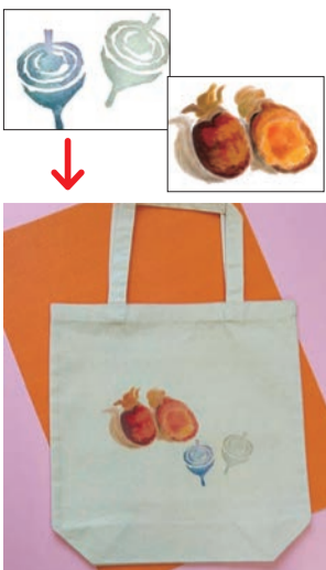
厚手コットンバッグ¥1,650(税込/素材、プリント代含み)

皆さん2024年の目標 は決まりましたか。一年の 始まりであるこの時期に習 い事を始めるのもいいです ね。形から入る私は、まず、 レッスンバッグを準備しよ うと思います。 パステル館の「フアブ