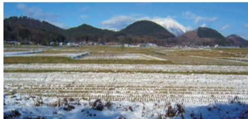
左から鉄塔がある生森、緑濃い石倉森と鉢森、伐採がすすむ勘十郎森と見立森がずらり…雪の岩手山を背に壮観なり

それに見立森は、 1956年に完成した御 所ダムの原石を採取した ため、山体が大きくえぐ られ、リハビリテーショ ンセンターが建つ敷地に なった。