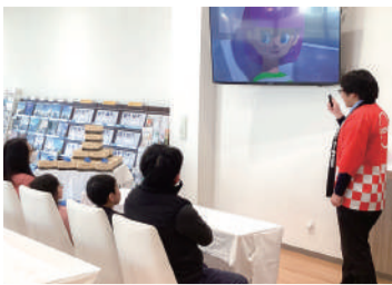
「おはなし」では映像と丁寧な解説を交えながら環境問題だけでなく、日産の最新技術についても教えてください

盛岡日産モーター本社北店では、地域社会への貢献と環境教育への取り組みの一環で「わくわくエコスクール」を開催しています。このユニークな取り組みは、将来を担う子どもたちに向けた、エコカーを開発・製造している日産だからこそ提供できる新しい環境技術の体験教室です。