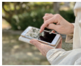
現在地だけでなく、行き先の経路も表示されて便利

今回は、地図アプリで自分が住んでいる町の市役所の名前を入力し、検索をしてみました。徒歩、車、公共交通機関などでの所要時間が出てきましたね。今回もそのまま市役所を例に話を進めていきます。