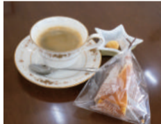
自家焙煎コーヒーのほか、焼き菓子も好評です。すぐ売り切れてしまうとか

いしかったって言っていたよ」と、お客さまの声に喜ぶ利用者さん。地域との交流が励みとなり、それが社会へ出る自信へとつながっています。