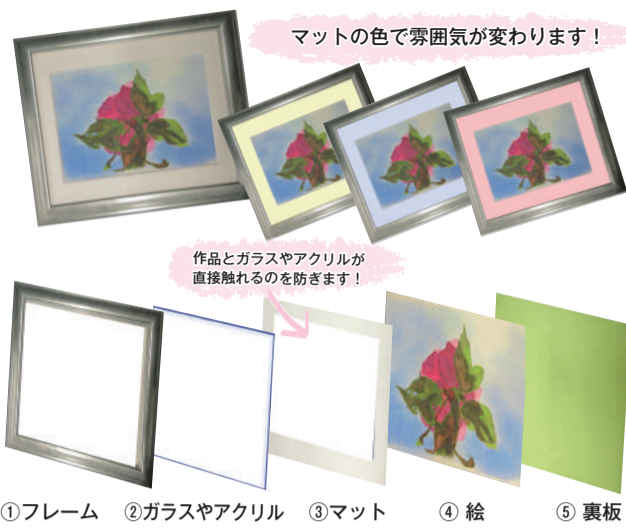
①フレーム ②ガラスやアクリル ③マット ④絵 ⑤裏板 ①～⑤の順に重ねると写真のような額装に仕上がります。

色鮮やかに描かれた絵や心に残るものや風景などを撮ったお気に入りの写真。管さされていますか。ファイ