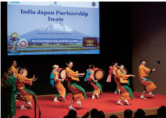
ホールでのさんさ踊りの披露の様子

「90年代、日本の存在感が大きかったのは国内市場だけでなく世界の大きな部分と関わる事ができた。しかし今は、世界の中での日本の比重が相対的に小さい。」