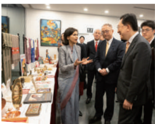
意見を交わすインド大使と達増知事

「90年代、日本の存在感が大きかったのは国内市場だけでなく世界の大きな部分と関わる事ができた。しかし今は、世界の中での日本の比重が相対的に小さい。」