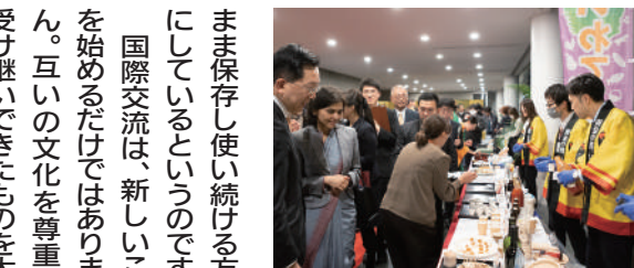
岩手デイ視察の様子

「90年代、日本の存在感が大きかったのは国内市場だけでなく世界の大きな部分と関わる事ができた。しかし今は、世界の中での日本の比重が相対的に小さい。」